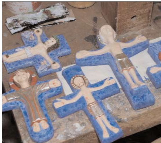
Es ist die Farbe Blau, die den Objekten in ihrer archaischen Einfachheit die nachhaltige Note gibt.