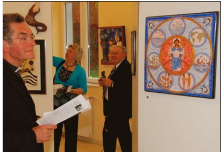
Auch der Lütticher Bischof Aloys Jousten konnte sich der Wirkung des mit Händen geformten Credo nicht entziehen.

Nach dem Erlernen eines „regulären“ Berufes (konkret: des Malerhandwerks) gilt seit seiner geopolitischen wie soziokulturellen Umsiedlung vom Ourtal an den Laacher See, besonders auf Antrieb sei-